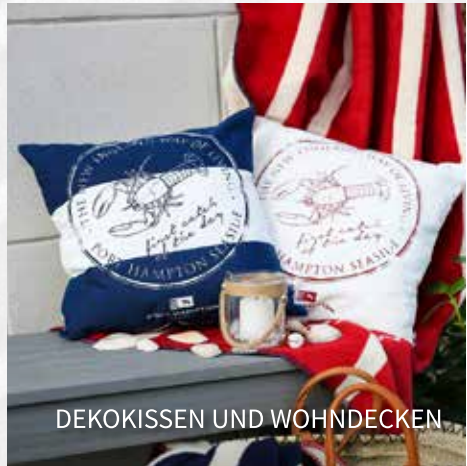
DEKOKISSEN UND WOHNDECKEN